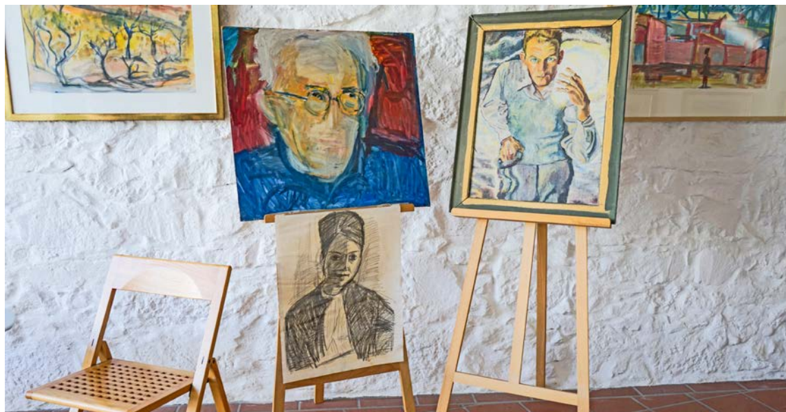
Drei unverkäufliche Bilder: Links die Eltern der Sammlungsinhaber und rechts ein Selbstporträt des Ramser Künstlers Joseph Gnädinger.