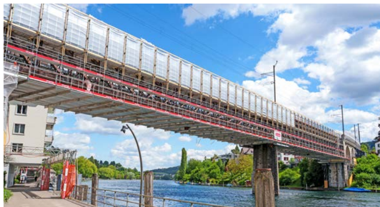
Die Eisenbahnbrücke zwischen Feuerthalen und Schaffhausen wird in den kommenden Monaten saniert.

Die Wahlvorschläge für den ersten Wahlgang am Sonntag, 27. September, sind bis spätestens 3. August bei der Gemeindekanzlei einzureichen. Massgebend ist das Eintreffen bei der Gemeinde und nicht das Datum des Poststempels. Bei Gesamterneuerungswahlen können sich auch zusätzliche Kandidatinnen und Kandidaten zur Wahl stellen. Das Formular «Wahlvorschlag» ist online oder kann bei der Gemeinde bezogen werden. (r.)