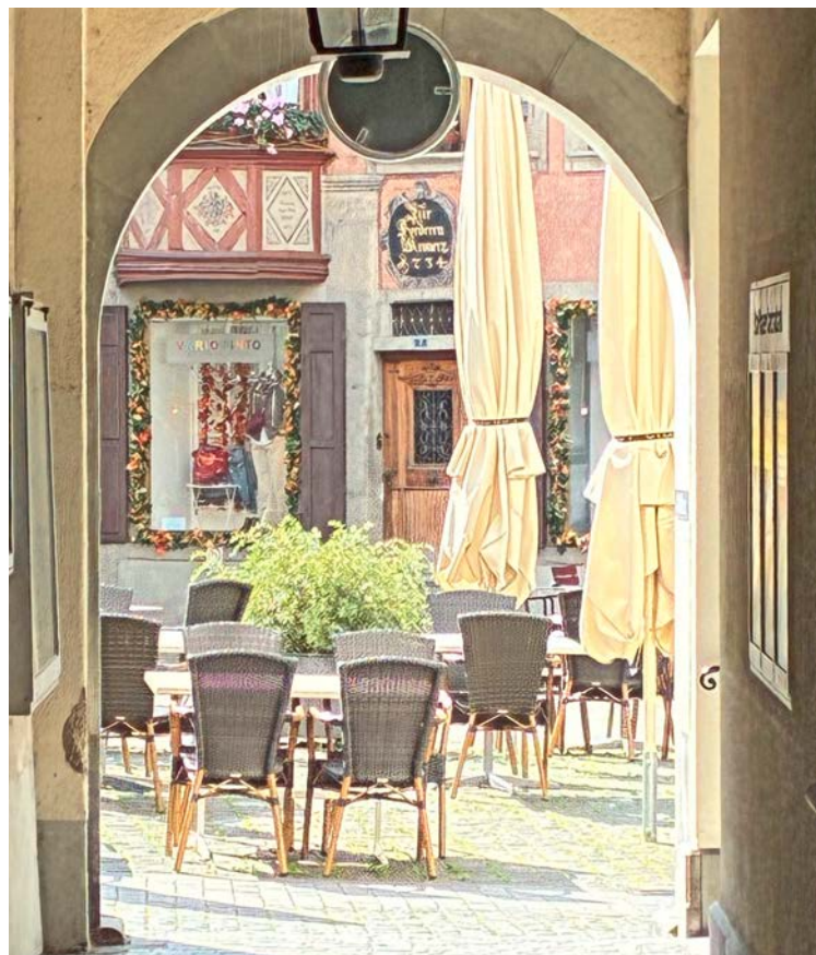
Durchblick auf die Morgensonne auf dem Rathausplatz Stein am Rhein.

Freiwillige Übung Rhyschützen , Schützenhaus Rheinklingen.