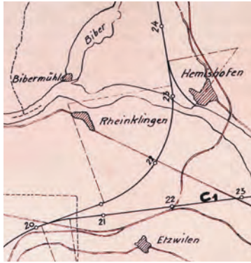
Kanalverlauf C1 und C2 im Raume Hemishofen nach Ingenieur Egenschwyler, 1915.