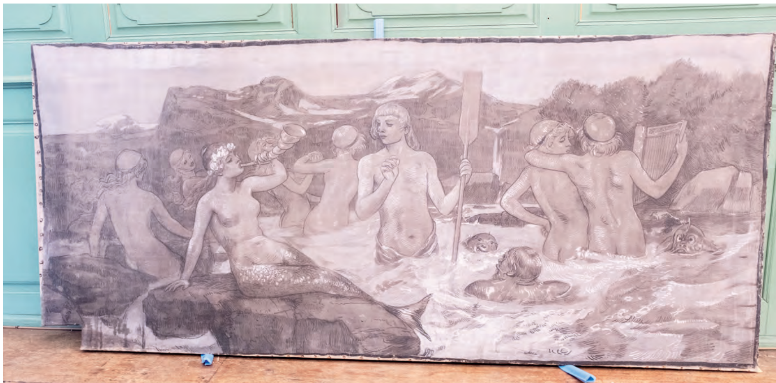
Die Quelle des Rheins: Eine symbolistische Darstellung des Basler Künstlers Hans Sandreuter (1850–1901).