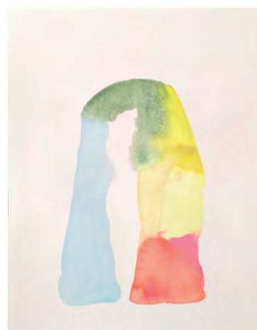
«B5», 2025.

Der Auftakt des Jazzfestivals Schaffhausen findet am Sonntag, 3. Mai, in Stein am Rhein statt. Programm auf Seite 8.