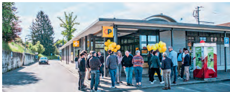
Die Postfiliale beim Bahnhof Stein am Rhein.