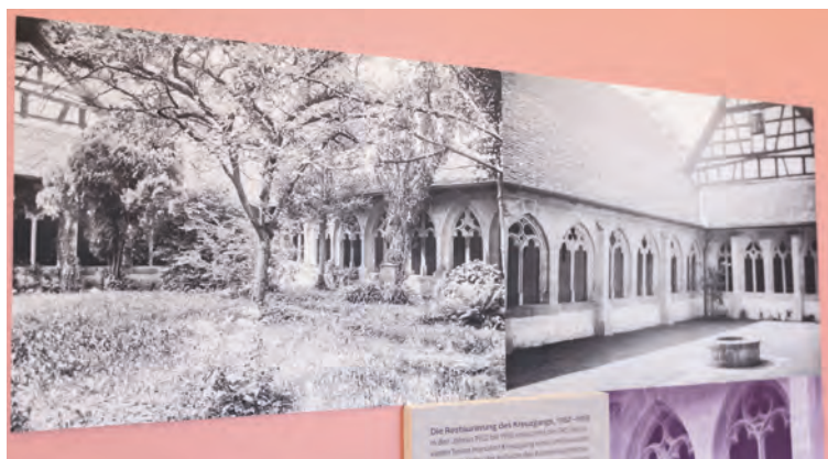
Die Ausstellung zeigt Gegensätze auf: Links der wild-romantische Kreuzgang zu Ferdinand Vettters Zeiten, rechts die sachlich-moderne Gartenanlage im 20. Jahrhundert.

«Heute versucht die Denkmalpflege, möglichst wenig zu verändern und das Vorhandene zu erhalten. Aber auch jede Generation bringt ihr eigenes Wunschbild mit», sagt Münch. Neu gebaute Elemente – etwa Betten oder Tische nach historischem Vorbild – sind als solche erkennbar, auch wenn dabei alte Techniken eingesetzt werden. Sein Fazit: «Geschichte ist immer auch eine Neuinterpretation