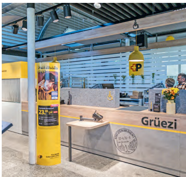
Zeitgemäss und persönlich: Die neu gestaltete Schalterhalle der Postfiliale Stein am Rhein.