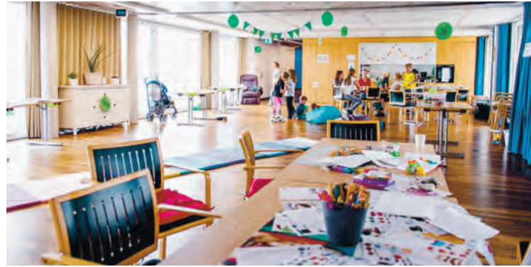
Vor drei Jahren eröffnete der Elternrat Ramsen den Mittagstisch.