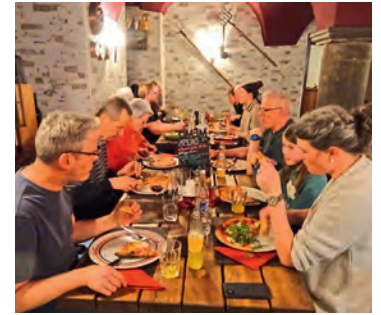
Die Versammlung der IG Grün Eschenz im «Raben».