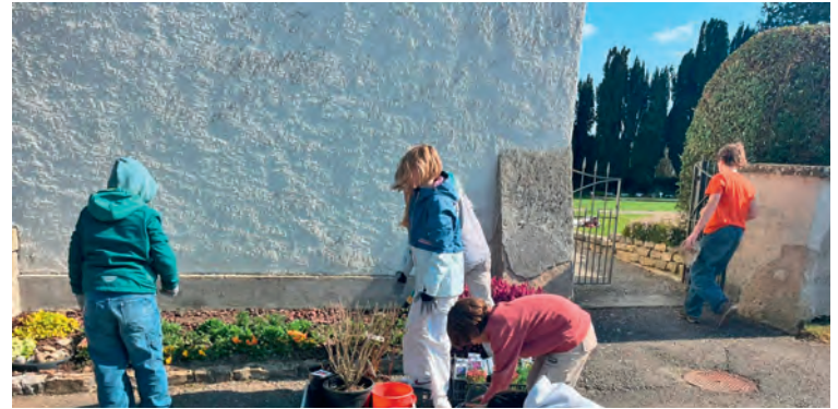
Die Kinder im vollen Einsatz bei der Kirche Burg.