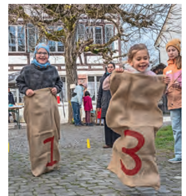
Besonderen Anklang fanden das Blechbüchenschiesen und das Sackhüpfen.