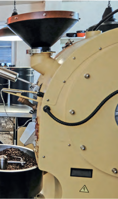
Café in Stein am Rhein.