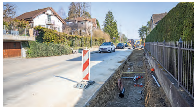
Auch an der Öhningerstrasse hat die bestehende Leitung ihre Lebensdauer erreicht und muss ersetzt werden.