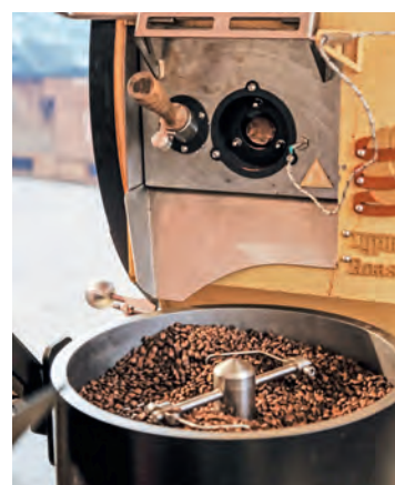
Das Ziel der Röstung: Fruchtig-blumiges Aroma.

Nach einer Aufwärmphase von acht bis neun Minuten beobachtet Uebelherr konzentriert die Profilkurve auf dem Monitor, schaut regelmässig auf die Uhr und zieht zwischendurch eine Probe aus der Maschine. Dann riecht er kurz an den Bohnen und entscheidet. Wenn der Moment gekommen ist,