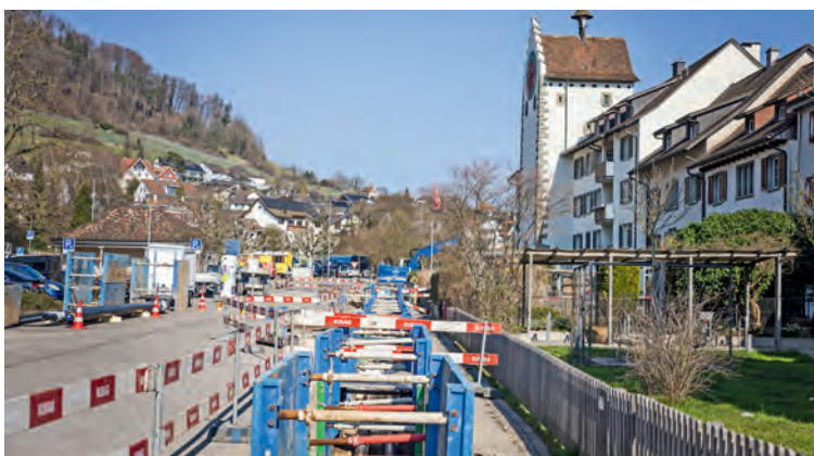
Die Leitungen an den Wärmeverbund werden auch über die Chlini Schanz beim Untertor erschlossen.

Die Pflasterung im Bereich des Chirrhofplatzes kann hingegen erst nach Ostern fertiggestellt werden, da die archäologischen Arbeiten dort noch andauern. «Solche Entdeckungen sind Teil der Arbeit in historischen Altstädten», so Gimmi. «Wir müssen immer damit