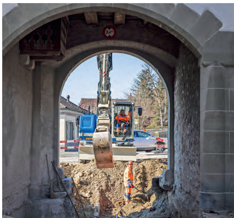
Die Arbeiten am Untertor in Stein am Rhein starteten Anfang Februar

In Stein am Rhein und Ramsen lasen Autorinnen aus ihrem Erstlingswerk. Seite 9 und 11