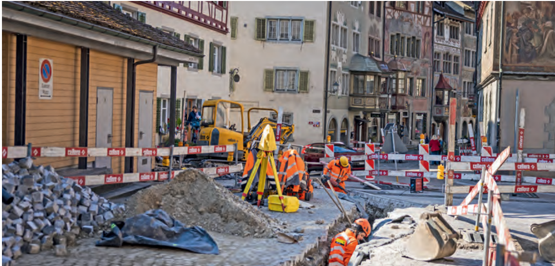
Beim Chirrhofplatz wird die Lichtsignalanlage beim durch den Kanton ersetzt.