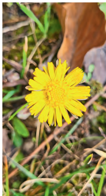
Huflattich: Vitalität und Energie aus der Natur.

So hat das Gänseblümchen sieben mal mehr Vitamin C auf 100 Gramm essbarem Anteil als Kopfsalat. Huflattich bringt es sogar auf zehn mal mehr. Ähnlich unterschiedlich sind auch die Werte bei