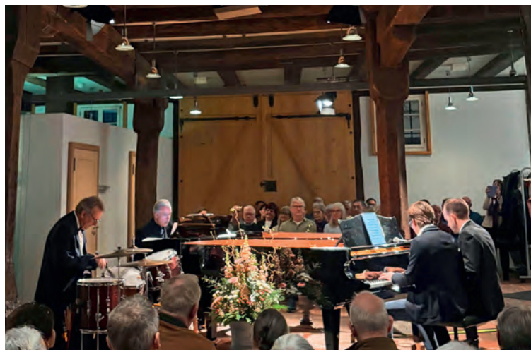
Ausverkaufte Plätze auch am 3. Piano Jazz Festival.

Oft verschmolzen diese unterschiedlichen Stilrichtungen zu spannenden musikalischen Mischungen. Die Kombination aus