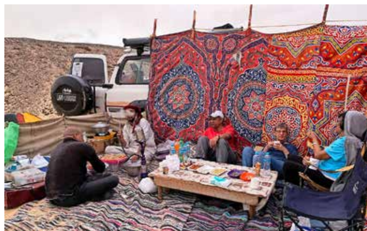
Der bunte Markt in El Kharga (l.) und beim gemeinsamen Apéro vor dem Nachtessen am letzten Abend in der Wüste.