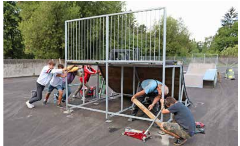
Freiwillige Jugendliche und Erwachsene beim Stellen der Elemente am neuen Standort bei der Steiner Kläranlage.

gericht gingen. Der Elternrat erreichte, dass diese abgewiesen wurden. Einzig ein Sonntagsfahrverbot wurde ihnen auferlegt. Mit der Unterstützung des Rotary Clubs Schaffhausen-Munot und den Jugendlichen wurde die Bahn aufgestellt und im September 2016 eingeweiht. Bis im vergangenen Sommer wurde sie rege – und ohne nennenswerte Unfälle – benutzt. Und die bisherigen Verantwortlichen fanden neue Nachfolger. (Sr.)