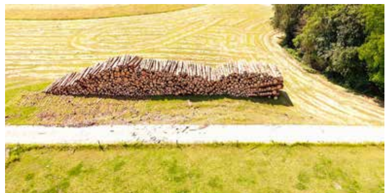
Das befallene Holz kann dank der Gemeinde, deren Pächter und dem Holzhändler für ein bis zwei Jahre in Hemishofen gelagert werden.