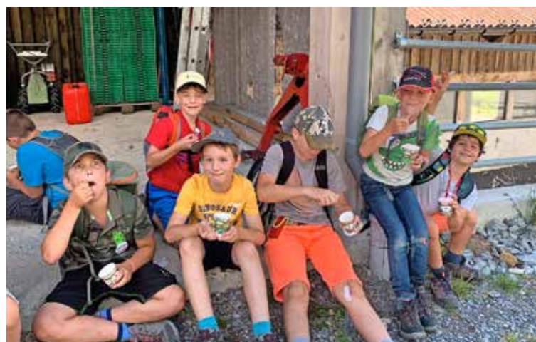
Nach einer anstrengenden Wanderung wurden die Kinder mit feinem Glace vom Bauernhof belohnt.