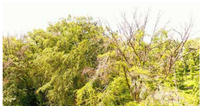
Folge der Trockensommer: Abgestorbene Buchenkronen in der Gemeinde Ramsen an der Strasse in Richtung Hofenacker.

Für das Ökosystem Wald hat all dies Vor- und Nachteile mit Blickwinkel auf die Artenvielfalt und die Waldverjüngung bezüglich des veränderten Klimas. «Für uns Menschen hat es vorwiegend Nachteile. Das Erfreuliche aber ist, dass nach dem Entfernen der abgestorbenen Bäume durch Naturverjüngung oder Pflanzungen nach zehn Jahren wieder ein kleiner Wald steht», stellt Stefan Haab klar. (Sr.)