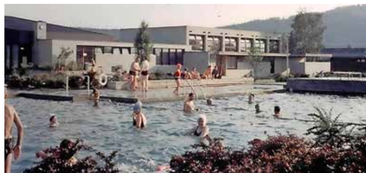
Historische Aufnahme vom Schwimmbad.

«Von da an mussten wir nicht mehr mit unseren alten Velos nach Hemishofen oder Gottmadingen «stampfen». Das war damals ein Riesenschritt in der Gemeinde.» «Das Schwimmbad wurde von der Feuerpolizei subventioniert, weil das Reservoir zu klein war», erinnern sich Zeitzeugen. Auch dass damals zwei Buben im Rhein ertranken, sodass man nicht mehr nach Hemishofen durfte. Damit die Bevölkerung das Freizeitangebot auch weiterhin nutzen konnte, stimmte die Bevölkerung 2007 einem Kredit von 540 000 Franken für die Sanierung des Schwimmbads zu. (r.)