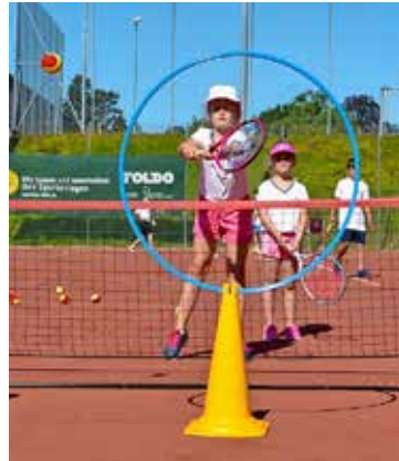
Die Kinder konnten je nach Alter und Spielstärke trainieren.

Ebenfalls ging Anfang letzte Woche in Kooperation mit der Pro Juventute Schaffhausen und Thurgau der «FerienSpass» über die Bühne, bei dem knapp ein Dutzend Kinder und Jugendliche die Gelegenheit nutzten, den beliebten Freizeitsport für sich zu entdecken.