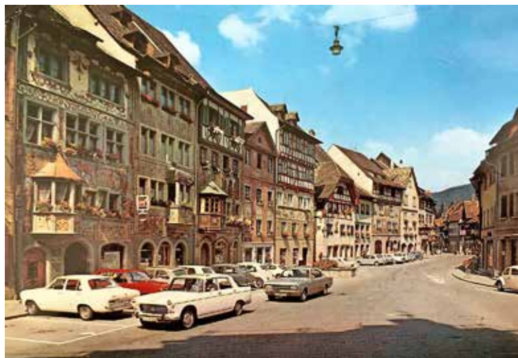
Vor 50 Jahren: In den 1970er-Jahren durfte man noch durchs Städtchen fahren und dort auch für kurze Zeit parkieren.