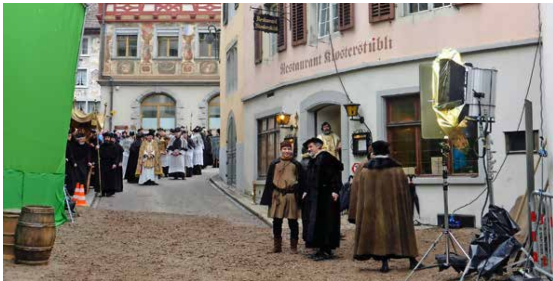
Auch die Rhigass wurde für eine Szene filmisch ins Jahr 1519 zurückgesetzt.

Diesen Ort könne man nicht vergessen, schwärmt auch Kameramann Michael Hammon. Die Offenheit und die Herzlichkeit der Steiner Bevölkerung, die sie so wunderbar unterstützt habe, seien erstaunlich. «Auch dass man unsere dominante Präsenz ertragen hat.» Er denke dabei an die wunderbaren und persönlichen Begegnungen in den Restaurants, auch zu unüblichen Zeiten. «Vor allem dass wir solch ein tolles, wertvolles, unschätzbare geschichtsträchtiges Motiv zur Verfügung gestellt bekommen haben, wo uns erlaubt war, in grosser Freiheit zu arbeiten.» Besonders gut in Erinnerung bleiben